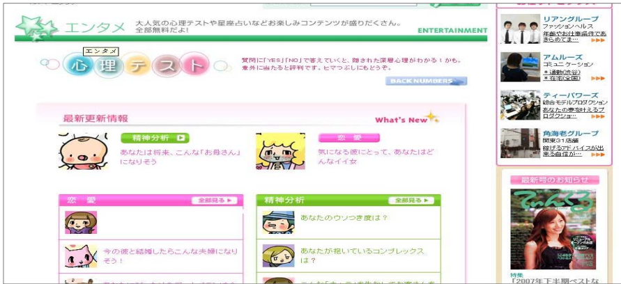
[그림3 성격심리테스트사이트 홈페이지 초기화면] 14)

이 사이트에는 정신분석테스트와 행동분석테스트가 들어가 있다. 정신분석테스트에는 거짓말에 대한 의식조사테스트, 열등감테스트, 고객확보테스트 등이 들어가 있으며, 행동분석테스트에는 애정관이나 도덕관 등을 가늠하는 테스트 등이 들어가 있다. 이러한 내용들 역시 학습자들의 인격 형성에 시사하는 바가 클 것으로 기대된다.