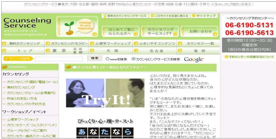
[그림2 정신건강심리사이트 홈페이지 초기화면] 13)

[그림2]는 정신건강심리테스트사이트 홈페이지의 한 화면인데, 이 홈페이지에는 정신건강(집착도, 자신감, 애정관, rich heart test 등)에 관련된 다양한 테스트가 들어 있다. 이러한 내용들은 학습자들의 인격 형성에 시사하는 바가 클 것으로 기대된다.